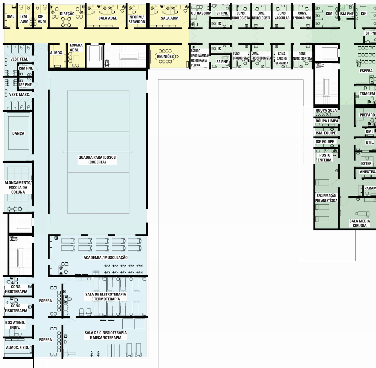
PLANTA PISO SUPERIOR