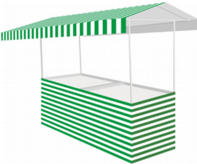
BARRACA PARA LEGUMES